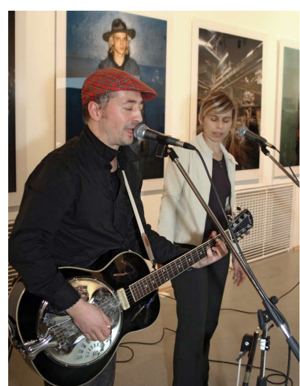
Hudební doprovod zajišťla skupina Longital, Bratislava